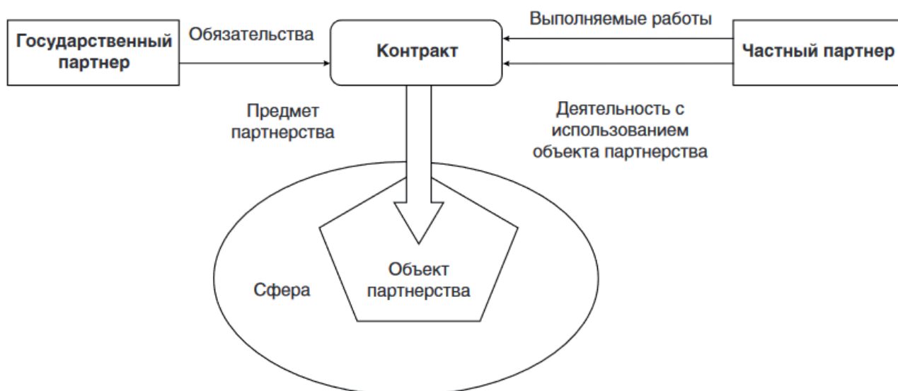
Рисунок. 1 Схема на примере взаимодействия государства и частного партнёра в проекте ГЧП

Представим ключевые преимущества ГЧП для государства: