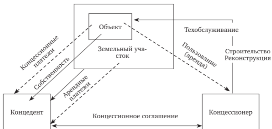
Рисунок 3. Общая схема реализации концессионного соглашения

Для нашего региона существует отдельная специально разработанная дальневосточная концессия. Впервые подписана в 2021 году на Восточном экономическом форуме.