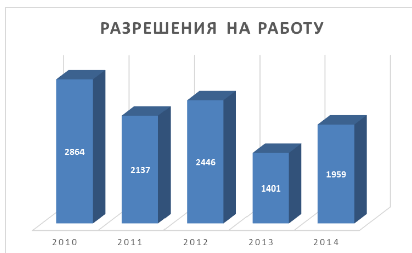
Рис. 2 Количество выданных разрешений на работу иностранным гражданам в Республике Бурятия за 2010-2014 год.

В2011 году количество выданных разрешений на работу составило – 2996. Главной сферой занятости прибывающих на территорию области иностранных работников являлось строительство.